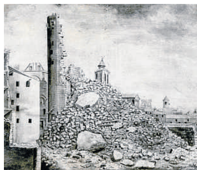
ARXIU JORDI ROVIRA

El 1703 va obrir les seves portes a un regiment d'infanteria i un de cavalleria provinents d'Itàlia. A mitjan segle XVIII Carles Boni en el seu Epítome historial (1752) descriu el castell dient: "Vecino a la catedral, que la compite en la grandísima mole, solidez y magnificencia de fábrica: ha quedado con el nombre de castillo del Patriarca, y sirve para cuartel de la tropa, capaz de acuartelar mucha más gente