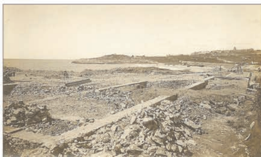
El inicio de obras del preventorio marítimo tuvo lugar en 1927.

La solución ideal para este espacio debería conjugar diversos intereses, de un lado la preservación de partes significativas del conjunto arquitectónico que permitan poner de relieve su valor, su función social en las épocas en las que estuvo en servicio, así como mantener y restaurar por lo menos alguno de los pabellones para un posible uso que revierta en la colectividad. En ningún caso parece aceptable proceder a una simple descatalogación